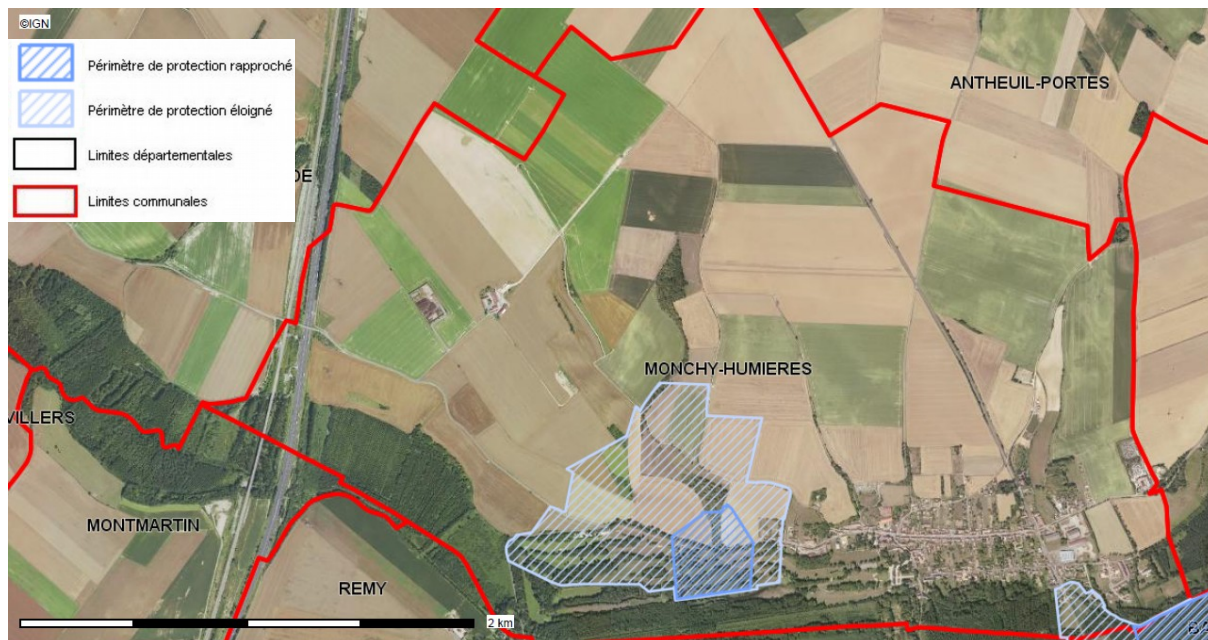
Carte publiée par l'application CARTELIE © Ministère de la Transition Écologique et Solidaire CP2I (DOM/ETER)